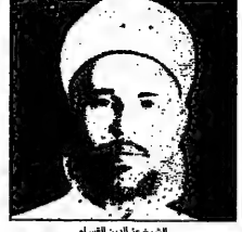
الشيخ علي بن الحسين